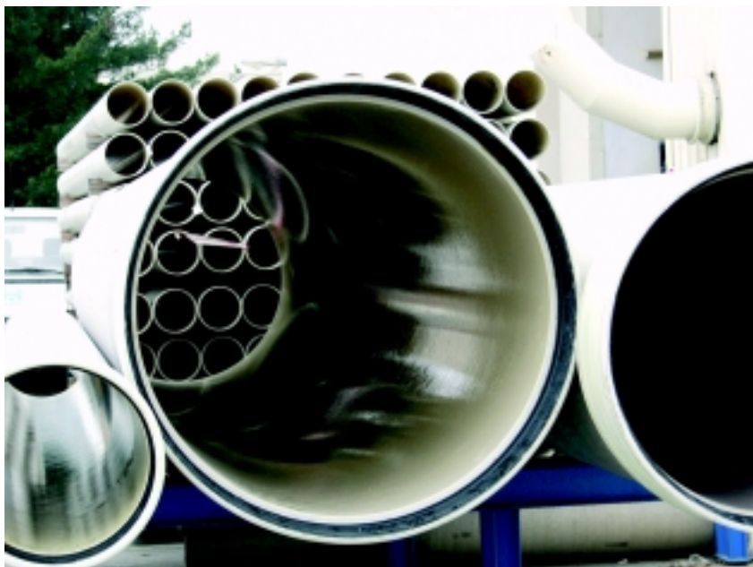
Tlakové CC-GRP trouby HOBAS®

Ize vyrábět v libovolných kombinacích tlakové a tuhostní třídy. Možné kombinace je nutné konzultovat s dodavatelem potrubí.